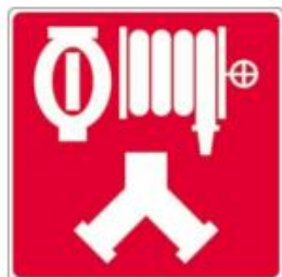
Raccords-pompiers pour le réseau de gicleurs et les cabinets d'incendie