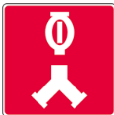
Raccords-pompiers pour le réseau de gicleurs