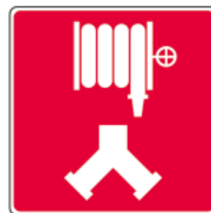
Raccords-pompiers pour les cabinets d'incendie