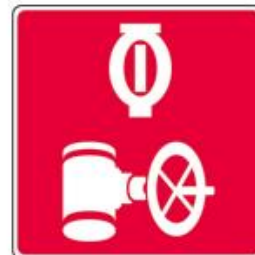
Valve du réseau de gicleurs