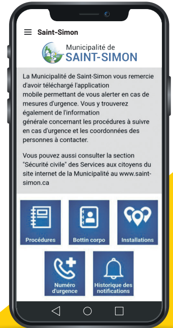
Visuel de l'application après avoir sélectionné

Pour les personnes ne possédant pas de téléphone intelligent, nous vous invitons à communiquer avec la Municipalité au 450 798-2276 poste 221 ou par courriel à l'adresse info@saint-simon.ca afin de convenir d'un autre moyen pour recevoir l'information, si ce n'est pas déjà fait.